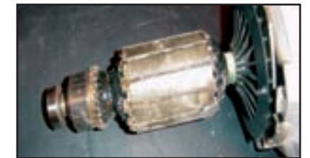
Der Anker ist durchgebrannt (überlastet)

Um eine lange Nutzungsdauer zu gewährleisten, sind die Motoren mit einem Kühllüfter ausgestattet. Die Effizienz dieses Kühlsystems steht in unmittelbarem Zusammenhang mit der Drehzahl des Ankers. Wird die Belastung des Motors erhöht, ist mehr Energie erforderlich, um die Nenndrehzahl des Motors beizubehalten. Bei lang anhaltender Belastung sinkt die Motordrehzahl und der Kühleffekt nimmt schnell ab. Dadurch steigt die Motortemperatur, was zu kritischer Überhitzung führen kann.