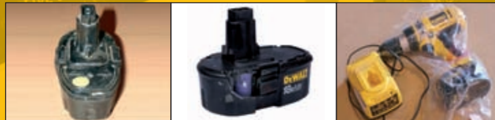
Der Anwender hat versucht, den Akku zu öffnen

Wenn es eindeutig ist, dass diese Richtlinien nicht eingehalten wurden, fallen resultierende Schäden am Akku oder eine zu geringe Leistung nicht unter die Garantie.