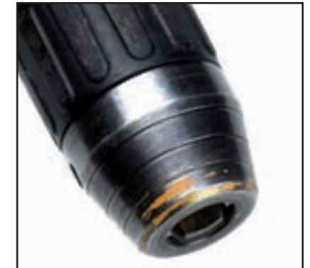
Die Abnutzung ist entstanden, weil die Bohrmaschine mit dem Spannfutter auf harten Oberflächen betrieben wurde