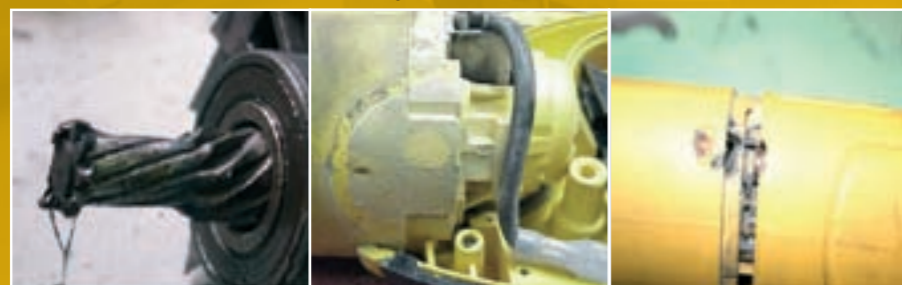
Ritzelabnutzung Extreme Verschmutzung / Rückstände Schäden, die durch Polierarbeiten mit Schleifmaschinen verursacht wurden

Zusätzlich zur Erklärung über „Abnutzung und Verschleiß“ bei unseren Produkten gilt die Garantie nicht für folgende Teile, es sei denn, es liegt ein Fertigungsfehler vor, den Sie als autorisierter Service-Partner als solchen beurteilen müssen: